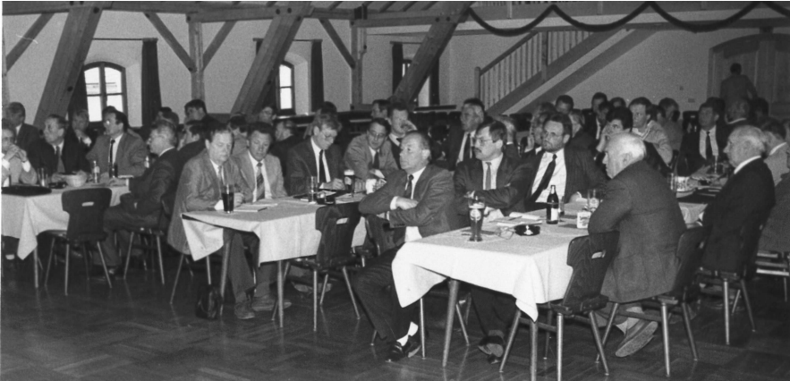
Die Gründungsmitglieder im "Postsaal" in Teisendorf

Initiiert von den Zweckverbänden Achengruppe und Surgruppe, sowie den Stadtwerken Traunstein nahmen an der Versammlung am 4. April 1989 in Teisendorf 62 Vertreter oberbayerischer Wasserversorgungsunternehmen teil und riefen auf Anregung der Obersten Baubehörde im Bayer. Staatsministerium des Innern, des Bayer. Landesamts für Wasserwirtschaft, des Bayer. Gemeindetages und des Verbandes bayer. Gas- und Wasserwerke die ARGE ins Leben.