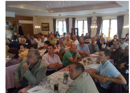
Frühjahrstagung am 28. Mai 2009 in Übersee am Chiemsee

AUFGABEN und ZIELE der ARGE Wasser Oberbayern sind